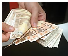
Arriva la 14esima: a chi spetta e come calcolarla