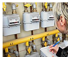
Ecco il nuovo contatore Enel: cosa cambia