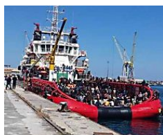
'Nessuno ci vuole affittare casa', la denuncia di una