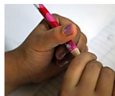
Adesca bimba davanti a scuola e la violenta, poi la riporta ai genitori